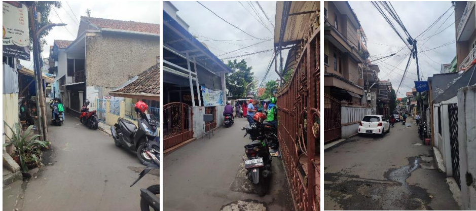
Gambar 3. Titik kumpul ojek online pada titik kumpul 2, 3, dan 4 (kiri ke kanan).