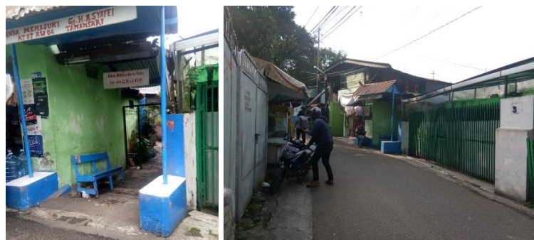
Gambar 2. Titik kumpul ojek online pada titik kumpul 1.

Berdasarkan 5 titik kumpul ojek yang terdapat di jalan Plesiran, pada titik kumpul 1 hingga titik kumpul 5 terlihat bahwa titik kumpul yang digunakan adalah penggunaan ruang publik berupa jalan Lorong (gambar 2-4). Pada sebagian jalan, jalan yang harusnya digunakan sebagai tempat sirkulasi pejalan kaki dan akses kendaraan motor telah digunakan sebagai parkir motor dan titik kumpul pengemudi ojek online.