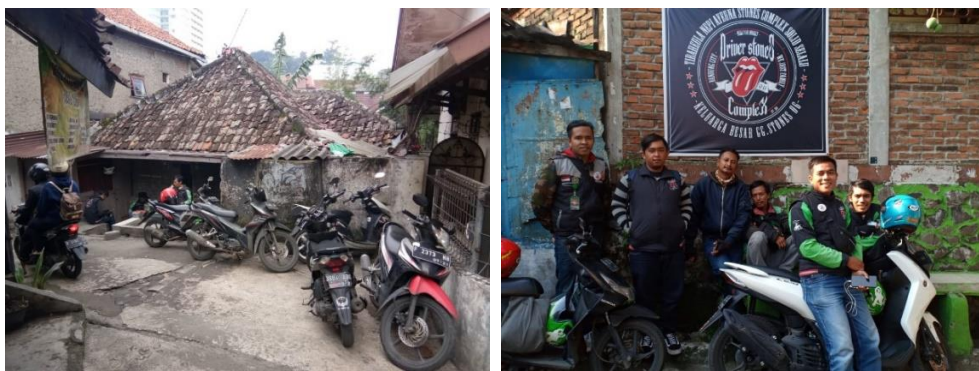
Gambar 4. Titik kumpul ojek online pada titik kumpul 5.

Pada hasil analisis ini akan dibahas bagaimana pengidentifikasian faktor-faktor pemilihan titik kumpul yang telah diperoleh berdasarkan jawaban responden yang dianalisis secara open coding . Pada tahap ini identifikasi faktor-faktor terkait pemilihan titik kumpul pengemudi ojek online dilakukan melalui 3 proses perseptual individual (kognitif, konatif, dan afektif) terhadap teori kualitas nodes (simpul) oleh Kevin Lynch. Setiap sub dalam teori persepsi dan teori elemen citra kota terlebih dahulu dikaitkan dengan respon (jawaban) pengemudi sehingga menghasilkan kata-kata kunci berupa faktor-faktor pemilihan tempat sebagai titik kumpul. Selanjutnya faktor-faktor tersebut dikaitkan kembali dengan teori elemen citra kota milik Kevin Lynch.