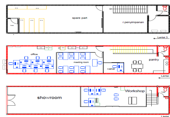
Gambar 2. Denah Tampak Atas Kantor PT. Daikin Airconditioning cabang Makassar